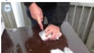
Lektion nr. 9 – flå / filetring af fladfisk Jesper Larsen, kommer med tips & tricks